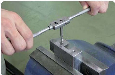
【ハンドルを用いての手廻し加工】