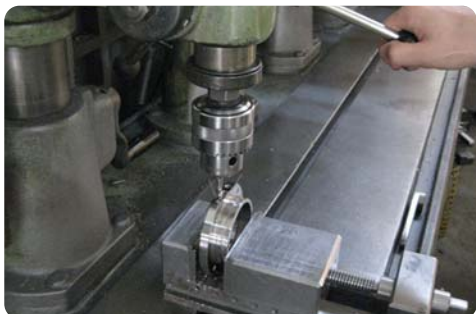
【ボール盤での機械加工】